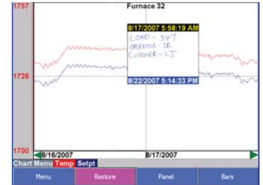
Built in Chart Recorder with Notes