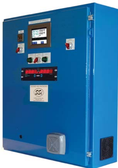
Model 5000 shown above with optional Televac MM200

По вопросам продаж и поддержки обращайтесь: