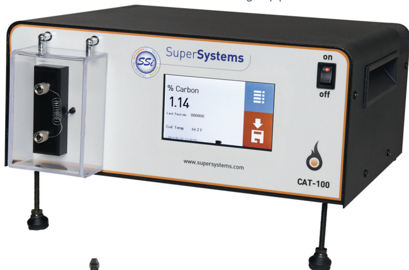
CAT-100 Part Number 13569

Insert the coil into the furnace, allow the coil to soak for 30 to 40 minutes, cool approximately 10 minutes, and insert into the testing apparatus for % Carbon readings