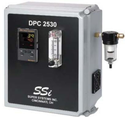
DPC2530 - Continuous Part Number 13118

The DPC2530 supports Modbus® RTU communications enabling the user to datalog the process variable.