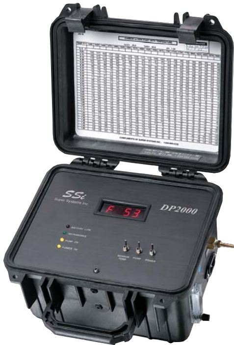
DP2000 - Portable Part Number 13070

The Model DP2000 is the most popular replacement for the analog dew point analyzers in the heat treat industry. Its digital display has taken the guess work out of measuring the dew point in endothermic and exothermic generators, atmosphere heat treating furnaces and tin-baths in the glass industry.