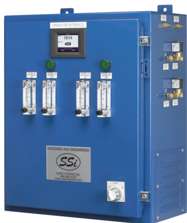
Model 4500 RPS-C

Includes Dual Probe Reference Air and Burnoff System