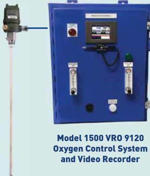
Model 1500 VRO 9120 Oxygen Control System and Video Recorder